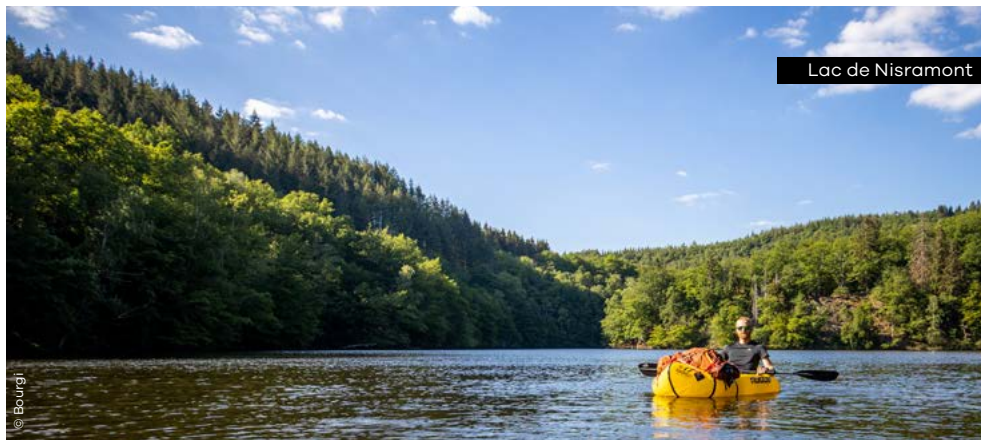
Lac de Nisramont